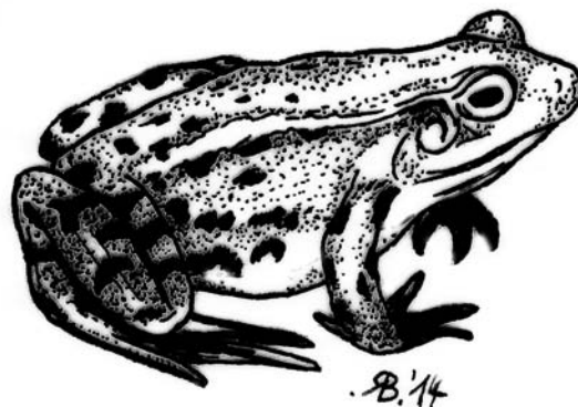
Teichfrosch ( Rana lessonae )