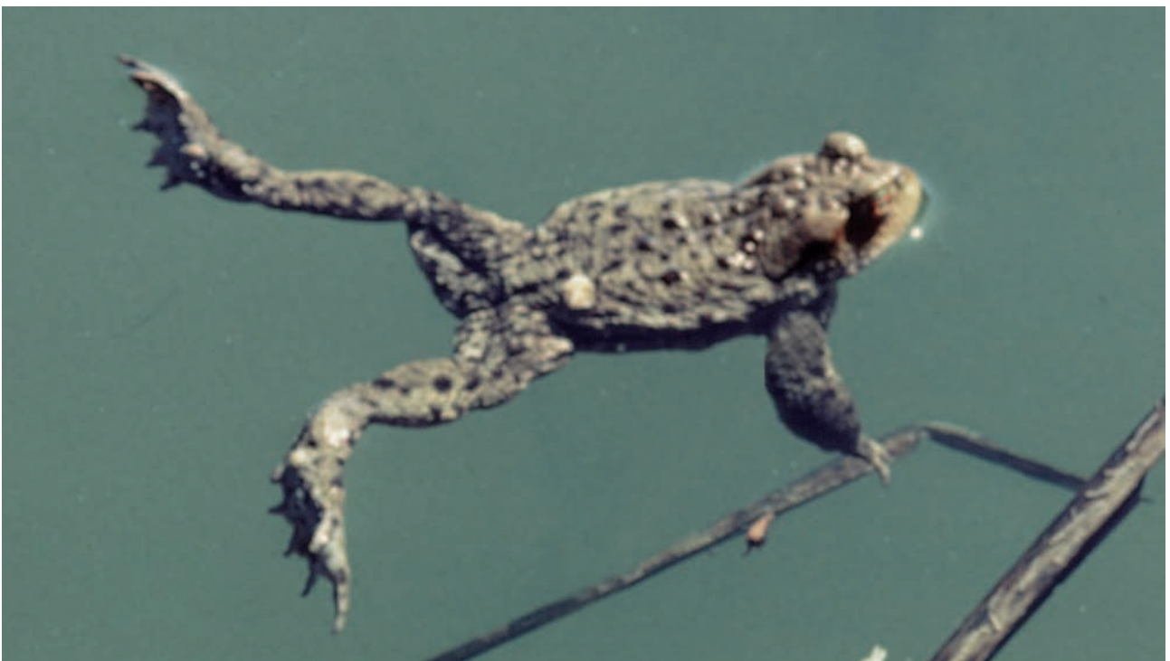
Erdkröte ( Bufo bufo ), Männchen