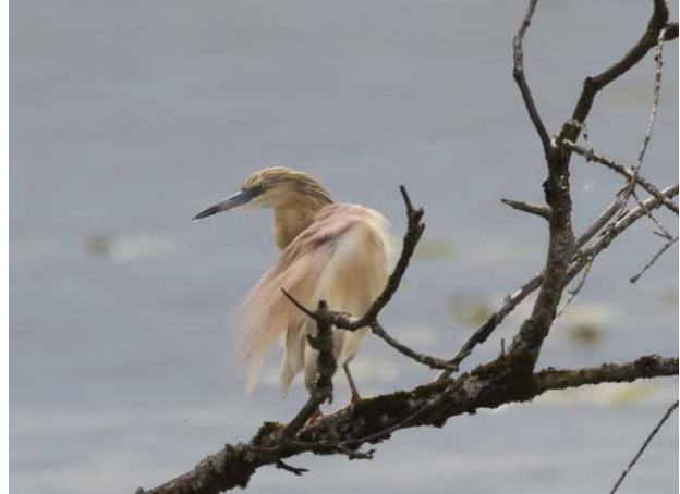
Rallenreiher, Foto: Christian Haass

Wir freuen uns sehr, dass wir wieder die wunderbaren Bilder der Vögel von Chr. Haass bekommen haben und bedanken uns an dieser Stelle dafür, dass wir sie in unserem Jahresbericht verwenden dürfen.