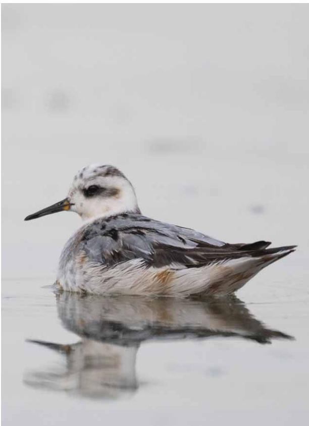
Thorshühnchen im Schlichtkleid, Foto: Christian Haass