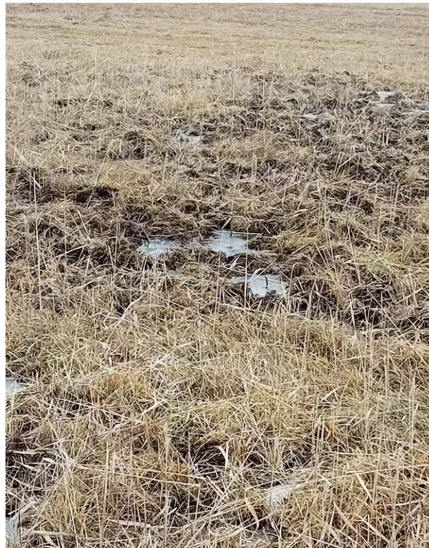
Von Wildschweinen »umgegrabene« Streuwiesen im Hofgarten

Für unser Kettenfahrzeug haben wir außerdem einen Frontmulcher gekauft. Damit können wir die Säume der kleineren Pflegeflächen bearbeiten und Stockausschläge beseitigen. Der Einsatz des Mulchers in buckeligen Bereichen schont außerdem unserer Balkenmäher ganz erheblich.