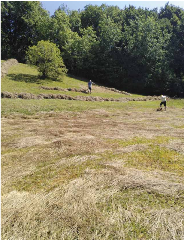
Handarbeit bei einem Arbeitseinsatz in Andechs