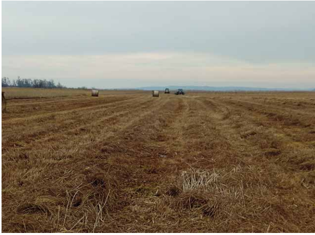
Streuballen in den Nördlichen Ammerwiesen, Foto: Markus Layritz