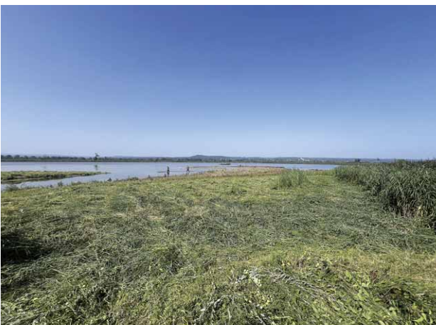
Helfer zum Ende der Mahd, Foto: Jana Jokisch

sukzession waren ab 2020 so weit fortgeschritten, dass ein Rückschnitt nur mit Freischneider nicht mehr gut möglich war. Außerdem war der Verein nicht mehr bereit, diese doch sehr aufwendigen Arbeiten unentgeltlich durchzuführen. Die Flächen wurden daher mit Kettenfahrzeug mit Front Mulcher gemulcht: Dafür war der Einsatz eines Baggers notwendig, um die Maschine auf die Inseln zu heben.