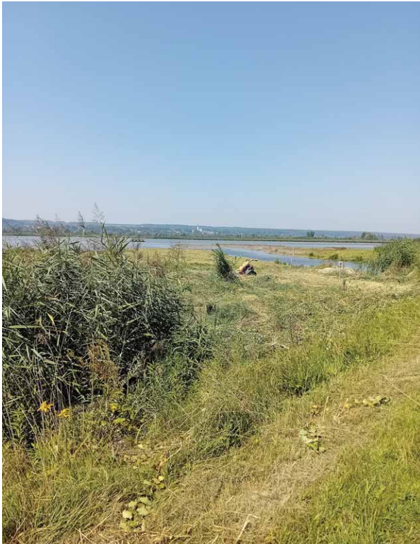
Unser Mulcher im Einsatz, Foto: Markus Layritz

Von 2020 bis 2024 wurde die Pflege durch LNPR Mittel gefördert. Der Aufwuchs und die Gehölz-