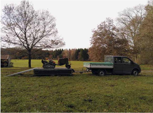
Der VW T5 Pritschenwagen im Einsatz, Foto: Helene Falk