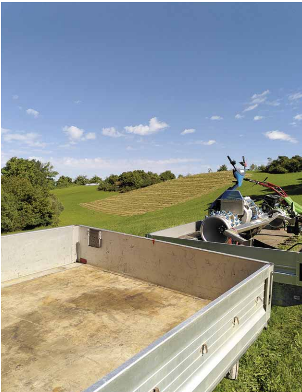
Im Hintergrund die gerade gemähte Fläche

Durch die inzwischen große Wildschweinpopulation im Ammersee Südufer waren Teile unserer Streuwiesen am Hofgarten regelrecht umgepflügt. Das hat die Mahd sehr erschwert. In Kooperation mit den Jagdpächtern wird versucht den Bestand deutlich zu reduzieren. Wie wir mit den geschädigten Flächen umgehen ist noch nicht endgültig geklärt. Einen Teil werden wir, wenn es von der Nässe her möglich ist mit dem Mulcher bearbeiten um wieder eine ebene Fläche herzustellen.