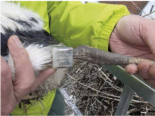
Beringung von Jungstörchen mit einem Sender