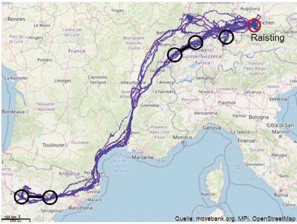
Zugwege und Überwinterungsgebiete von Hui Buh seit 2019