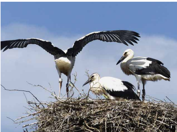
Weißstörche in Raisting mit Senderringen links

»Maxi«, und »Alex«. Um den 11. August zogen die meisten Jungen ab, darunter auch der besenderte Nachwuchs. Auf dem Web-Portal »movebank.org« unter dem Projektnamen »Life Track White Stork Bavaria« oder über die App »Animal Tracker« konnte ihr Weg verfolgt werden, der sie ohne größere Verzögerungen über die Schweiz und Südfrankreich an die Südspitze Spaniens führte. Alle vier überquerten die Meerenge von Gibraltar zwischen den 24. und 29. August, also nach nur 13–18 Tagen. Ziel war für die meisten Störche eine Deponie in der Nähe von Rabat an der marokkanischen Atlantikküste, rund 2150 Kilometer entfernt. Leider wurden danach fast keine aktuellen Positionen mehr an die Datenbank übermittelt (Stand Anfang Februar 2026), die Spur für Fridolin brach am 6.1.2026 ab, für Alex Mitte November