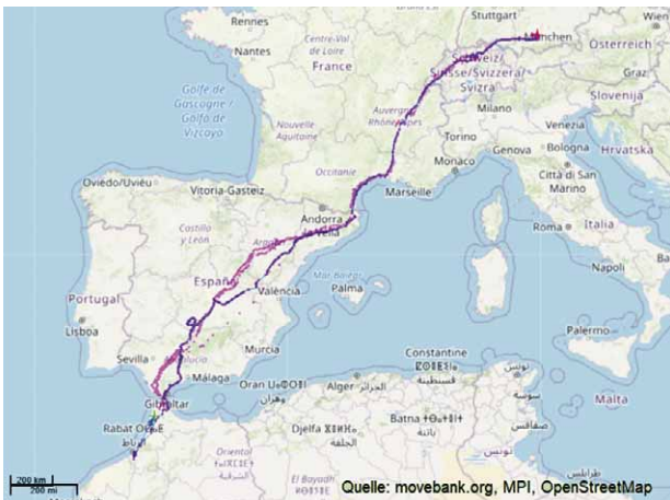
Zugweg der besondern Jungstörche, blau: Fridolin