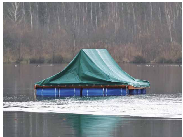
Abb. 5: Zeltdachabdeckung auf dem neuen Brutfloß in der Oberpfalz, Foto: Regina Krieger

Des weiteren wurde ein bisher kaum bekannter (potenzieller) Konkurrent im Vogelschutzgebiet Garstadt (SW) in Unterfranken beobachtet. Mindestens