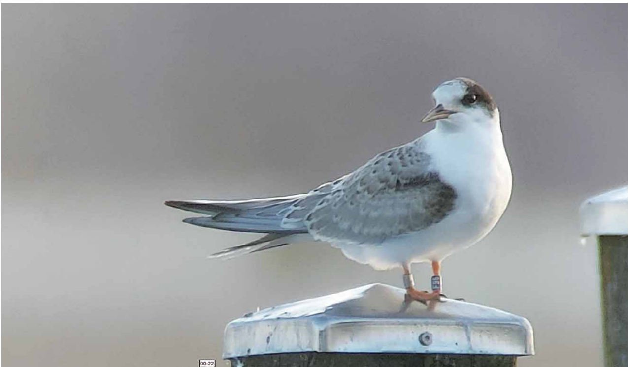
Abb. 6: Beringte diesjährige Flusseeeschwalbe am Starnberger See

Über den QR-Code gelangt man direkt zum Beitrag in der Mediathek.