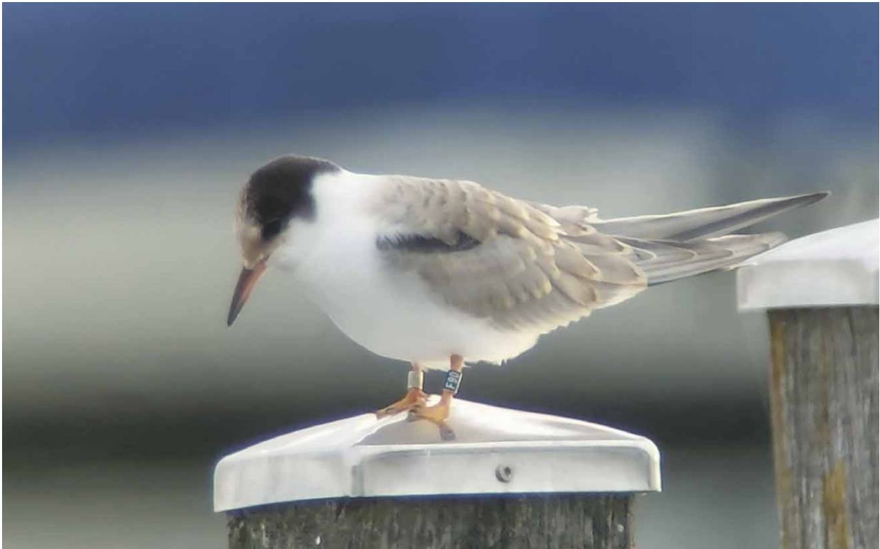
Diesjährige farbberingte Flusseeschwalbe »F90« am Starnberger See