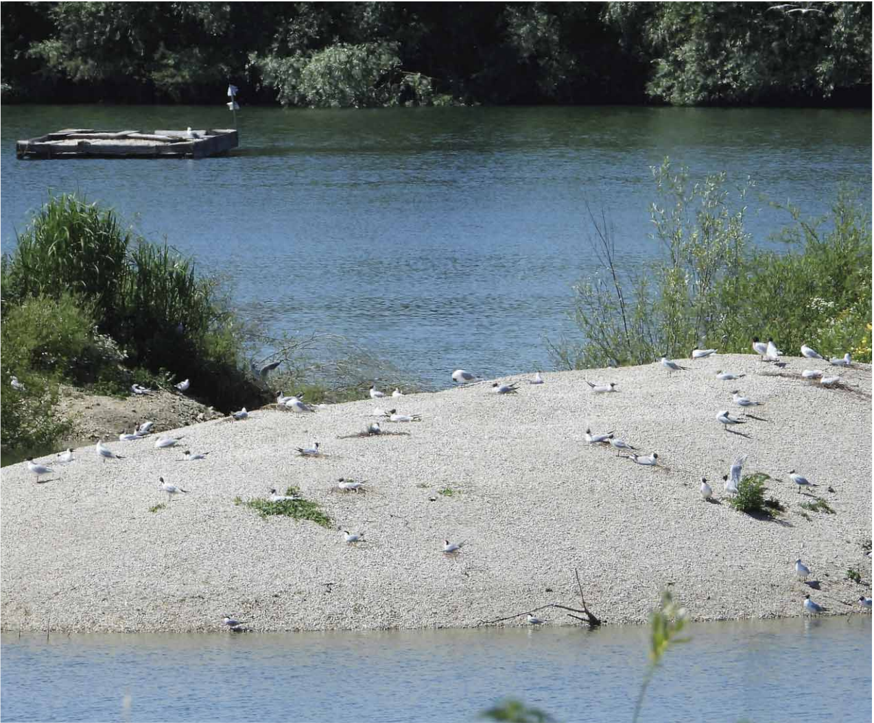
Abb. 4: Auf der neu aufgeschütteten Kiesinsel im Eistaucher-Weiher bei Pocking (PA), brüteten dieses Jahr Flusseeeschwalben, Lachmöwen und Schwarzkopfmöwen. Das Floß wurde durch ein Mittelmeermöwen-Paar besetzt (hinten links im Bild), Foto: Regina Krieger

wiss. Einige Paare wichen anschließend auf die Inseln im benachbarten Fetzer Flachwassersee aus (Tabelle 1, 2). Auch auf dem Floß am Ammersee gab es Brutversuche von Kolbenenten. Nilgänse ( Alopochen aegyptiaca ) und Flusseeeschwalben brüteten gemeinsam auf dem Floß in der Oberauer Donauschleife. Erst nach dem Schlupf der Nilgänse mussten die Betreuer eingreifen, die Gänseküken vom Floß holen und ins Wasser zu den wartenden Eltern setzen. Danach kehrte wieder Ruhe ein.