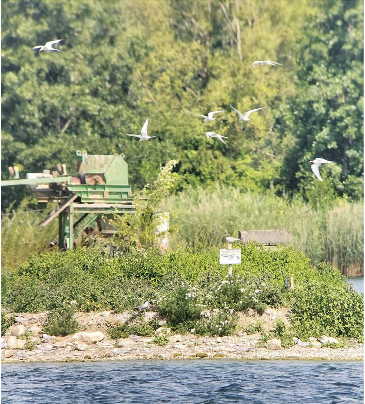
Abb. 2: Die größte bayerische Flussschwärmer-Kolonie befand sich 2025 auf einer Kiesinsel im Schimmerweiher (ND), Foto: Andrea Gehrold

Zu einer Wiederbesiedlung kam es am Donaustausee Faimingen (DLG) und bei Ering am Unteren Inn (PAN), wo ebenfalls angeschwemmte Baumstämme als Brutplatz genutzt wurden. Auch auf den Flößen am Mindelstausee Jettingen (GZ) und am Schielein-Weiher bei Nötting (PAF) konnte nach